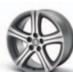
Диск легкосплавный 18", стиль 10