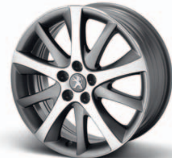
Диск легкосплавный 18", стиль 08

*Поставляются без установочных болтов и колпачков.