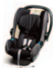
Romer Baby Safe + Категория: 0 9648 E8

Предлагается ассортимент сидений, обеспечивающих оптимальный комфорт при перевозке детей (от новорожденных до детей массой 36 кг). Сиденья протестированы и одобрены в соответствии с самыми строгими стандартами безопасности (Европейский сертификат ECE R44/03).