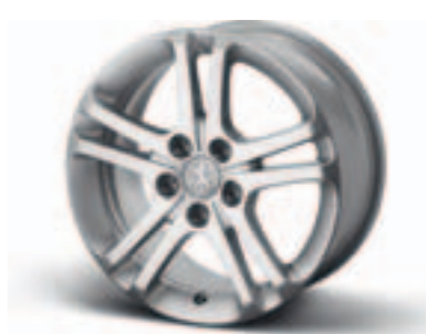
Диск легкосплавный 16", стиль 03 9607 S8