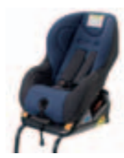
Fair G0/1 Isofix Категория: 0, 1 Обратитесь к обслуживающему вас дилеру.