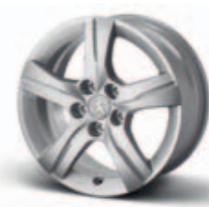
Диск легкосплавный 16", стиль 02 5402EX