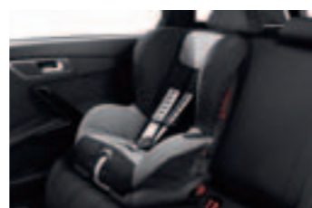
Romer Duo + (с 3-точечными креплениями Isofix) Категория: 1 9448 15