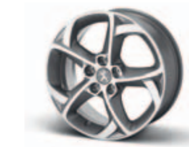
Диск легкосплавный 17", стиль 06