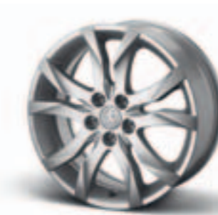
Диск легкосплавный 17", стиль 05

Комплект из четырех дисков — 1607103980*