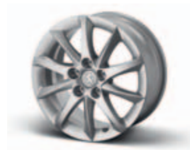
Диск легкосплавный 16", стиль 01 5402EW