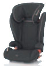
Romer Kidfix Категория: 2, 3 9448 18