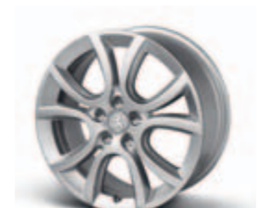
Диск легкосплавный 18", стиль 07