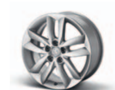
Диск легкосплавный 17", стиль 04 5402 EY

Комплект из четырех дисков — 1607103980*